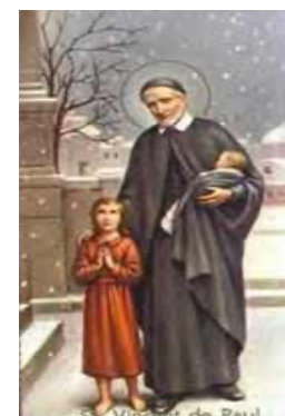
Saint Vincent de